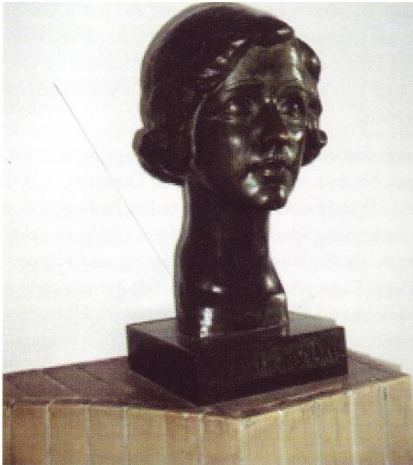
Büste der Fürstin (Foto Schuleingang)